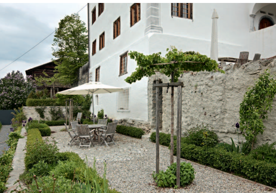
Zur Firmenphilosophie gehört auch die Förderung der Gartenkultur. Im Bild die von «Zuber Aussenwelten» gestaltete Umgebung eines historischen Gebäudes.