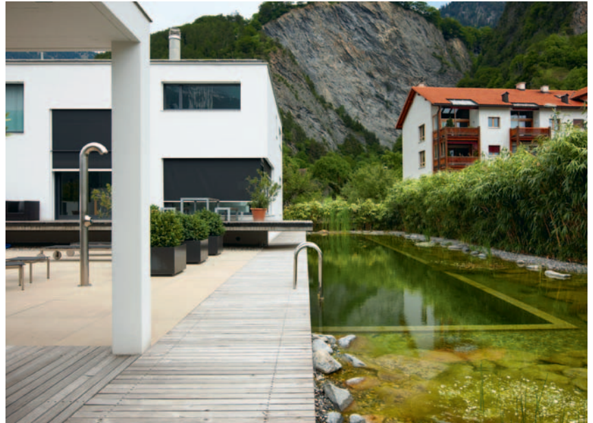
«Zuber Aussenwelten» gestaltet Gärten von klein bis gross. Im Bild ein formaler Naturpool, von einem schlichten Holzsteg gefasst.

Text: Caroline Zollinger , Gais