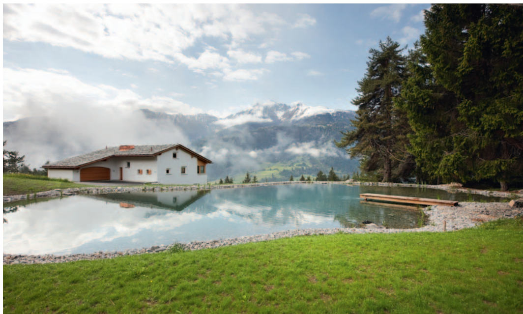
Schwimmteich vor imposanter Bergkulisse: Bei den Gestaltungen wird die Umgebung miteinbezogen.